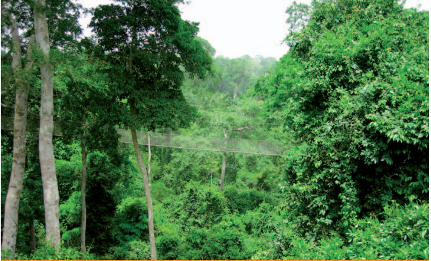
Fig. 4. Het bos in Ghana.

softwareontwikkeling, te starten met een prototype, dat getest gaat worden in een land waar zoveel mogelijk verschillende rechtsverhoudingen zich voordoen als boven beschreven. Het prototype wordt gemaakt door het ITC in samenwerking met het GLTN en de FIG. De Wereldbank heeft voorgesteld om opnieuw Ethiopië te nemen als pilotgebied voor een uitgebreide test van het prototype.