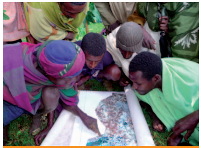
Fig. 1. Foto a la GIM International.

Kadasters vormen de basis om rechten op onroerende zaken inzichtelijk te maken, evenals de beperkingen die er op rusten en de verantwoordelijkheden die dit grondbezit met zich meebrengt. Daarbij bestaat een duidelijke relatie met het grondbeleid, de locatie, en de mensen in hun rol als recht- of belanghebbende. 'Rechten op grond' betreffen normaal gesproken de rechten van eigendom en bezit, terwijl 'beperkingen' betrekking hebben op grondgebruik en de activiteiten die er wel en niet op mogen plaatsvinden. De genoemde 'verantwoordelijkheden' betreffen vooral de sociale en ethische verplichtingen dan wel iemands morele houding ten opzichte van duurzaamheid en goed rentmeesterschap. Deze drie zaken (rechten, beperkingen en verantwoordelijkheden) moeten zo ontworpen zijn, dat ze aan behoeften in afzonderlijke landen tegemoet komen en moeten netjes verdeeld zijn over de verschillende bestuurslagen van de overheid. Sprekend over toepassingen wereldwijd, dan is dit vooral geïnspireerd door de waarneming hoe op diverse