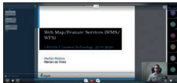
Impressie van online onderwijsplatforms

Sinds halverwege het derde kwartaal wordt het onderwijs bij de TU Delft (en elders) geheel online verzorgd. Dit heeft grote gevolgen voor de studenten en de staf van zowel de MSc GIMA als de MSc Geomatics. Hoewel de MSc GIMA als een mix van contact- en afstandsonderwijs is ingericht, zijn juist de contactweken altijd erg belangrijk. In deze twee weken vinden de afronding van eerdere modules plaats (tentamen, presentaties), de start van nieuwe modules (colleges, practicums), de midterm presentaties en afstudeerpresentaties en ook de diploma-uitreikingen. Helaas moesten de van 23 maart tot 3 april geplande contactweken in Wageningen online plaatsvinden. Dankzij inzet van docenten en studenten zijn alle onderwijsonderdelen uitgevoerd, al blijft het vreemd om een afstudeerpresentatie te geven vanaf je zolderkamer. Inmiddels lopen nu de reguliere 11 weken